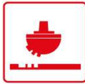
Encres et vernis de sérigraphie et tampographie