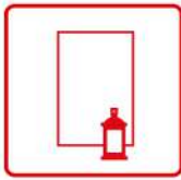
Produits pour écrans sérigraphie