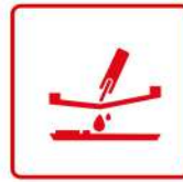
Matériel de sérigraphie