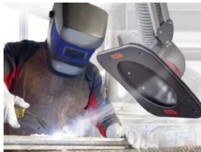
Traitement de l'air