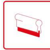
Racles et accessoires