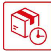
Conditionnement/ Sous-traitance industrielle