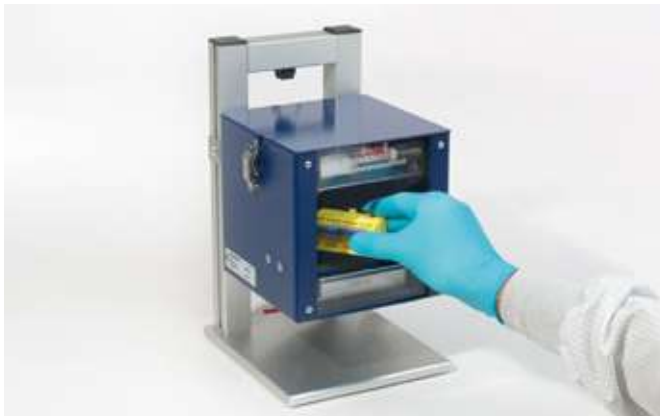
Reinigung von kleinen Bauteilen während des Montageprozesses Cleaning of small parts during assembly