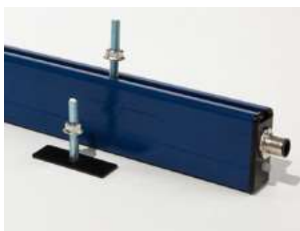
Montage durch verschiebbare Nutensteine M6 Mounting by sliding brackets M6

Hinweis: Technische Informationen s. Zubehör/Datenblatt Advice: Technical information s. Accessory/Datasheet