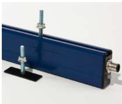
Montage durch verschiebbare Nutensteine M6 Mounting by sliding brackets M6

Hinweis: Technische Informationen s. Zubehör/Datenblatt Advice: Technical information s. Accessory/Datasheet