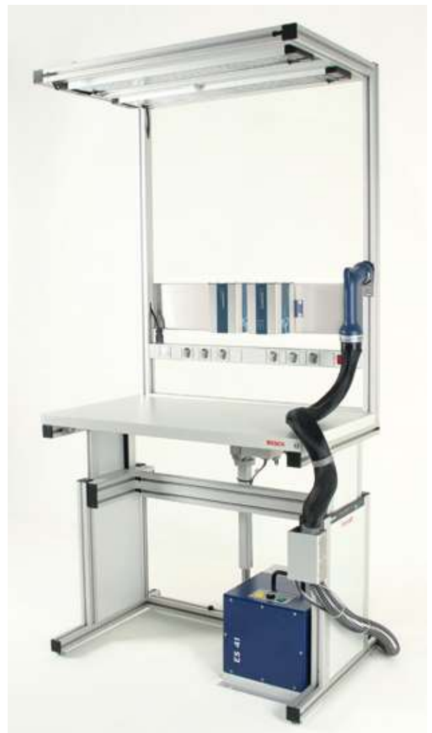
Arbeitsplatzbeispiel Example workplace

Hinweis: Technische Informationen s. Zubehör/Datenblatt Advice: Technical information s. Accessory/Datasheet