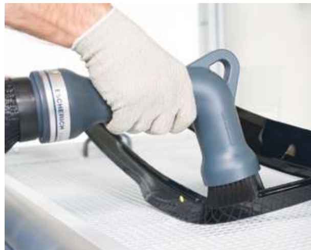
Anwendungsbeispiel ELEPHANT 110 Example application ELEPHANT 110