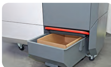
Tiroir de collecte de 90l avec carton à déchets.