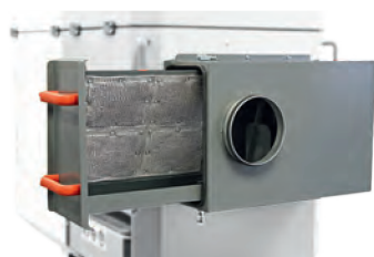
Trappe de maintenance latérale pour le nettoyage du préséparateur.