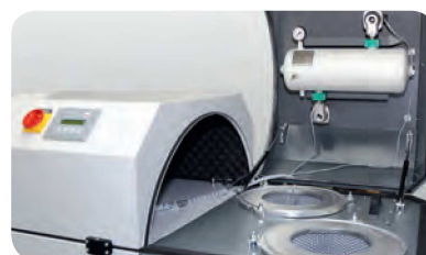
Le haut du filtre bascule pour accéder aux filtres et au système de décolmatage pour une maintenance aisée.